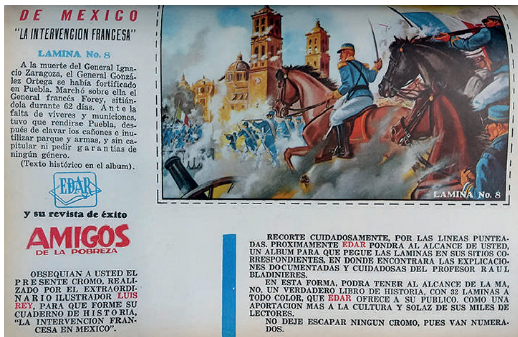
Lámina 2. Contraportada.