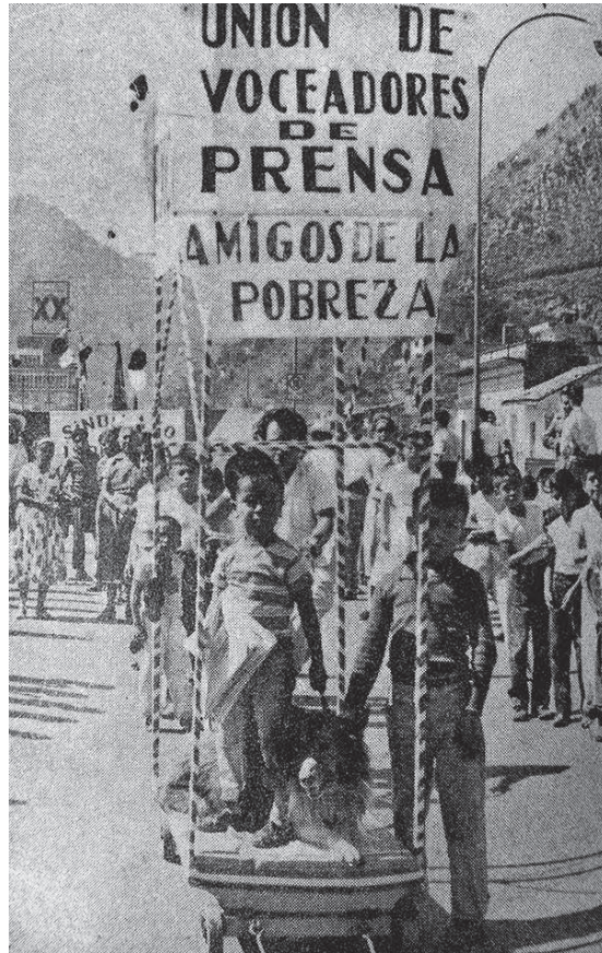
Figura 3. Contraportada.

ningún modo crítico hacia la precaria situación en la que, durante el primer lustro de la década de los años sesenta, se encontraban 27 038 625 de mexicanos, 16 y en cambio sugería que la pobreza no era una condición que debía rechazarse, que supusiera algún tipo de dominación, o que resultara intolerable. De la pobreza se podía ser incluso amigo , y