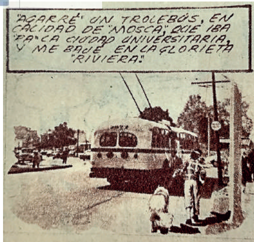
Lámina 3.