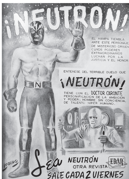
Figura 1. Contraportada.