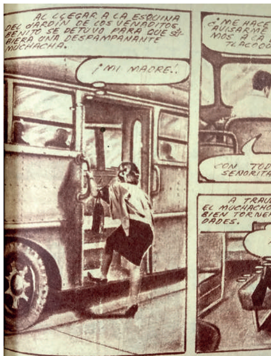
Lámina 1. Amigos de la Pobreza , n. 6, 4 de enero de 1962, p. 23