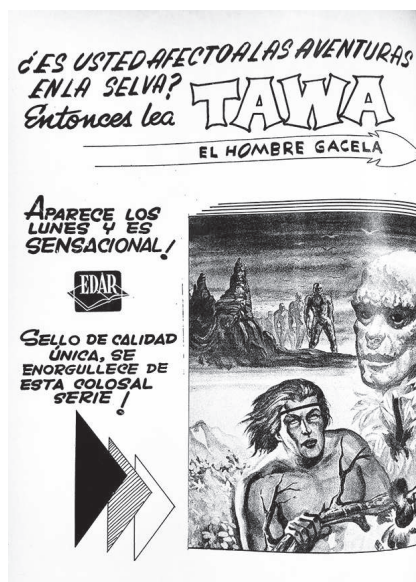
Figura 2. Portada interior.

Fuente: Amigos de la Pobreza , Editorial Argumentos, México, n. 2, 7 de diciembre de 1961